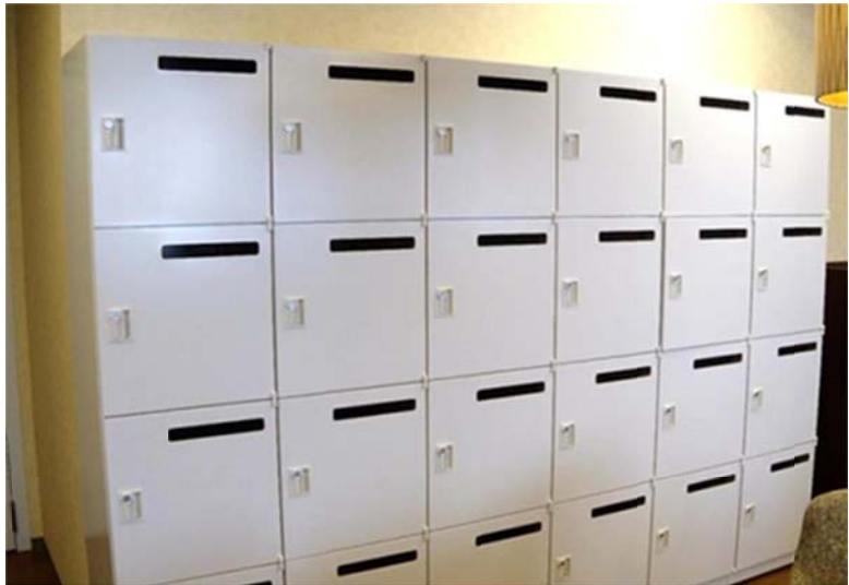
産業医共同事務所内 個人情報保管用ロッカー