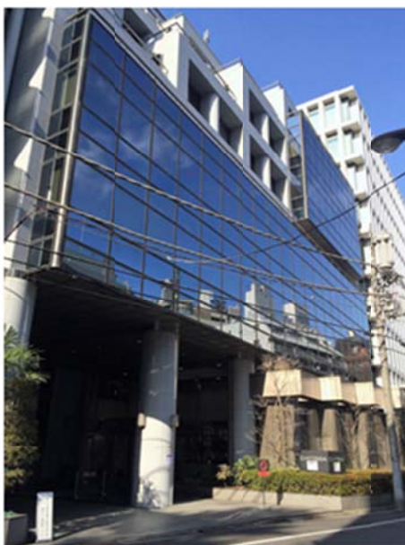
産業医共同事務所がある千代田ビル